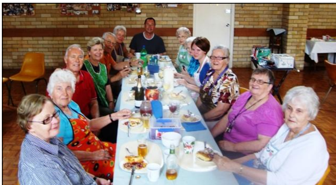
Pelnītas pusdienas. Izcepti 20 kg!