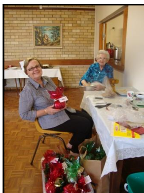
Baiba un Lonija