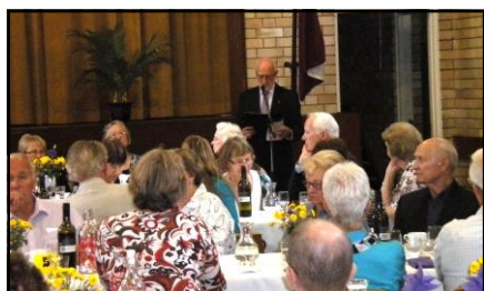
Priekšnieks lasa apsveikumus!