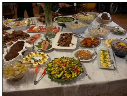
Baudījām McPherson vīnu un ļoti garšīgas pusdienas.